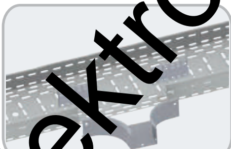
Приклад складання лотків і акcesуарів