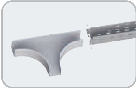
Приклад складання лотків і акcesуарів